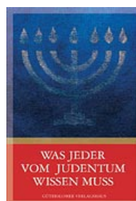
Cover der 10. Aufl. 2007